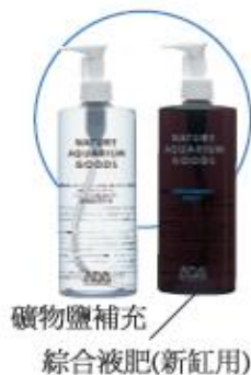
礦物鹽補充 綜合液肥(新缸用)

水草的成長主要有賴營養元素，當鉀含量偏低，氮和磷就由缸內自然產生。以Brighty K之鉀補充是高效並能促進光合作用產生。當沒有大量藻類時，補充微量元素亦是非常有效的。